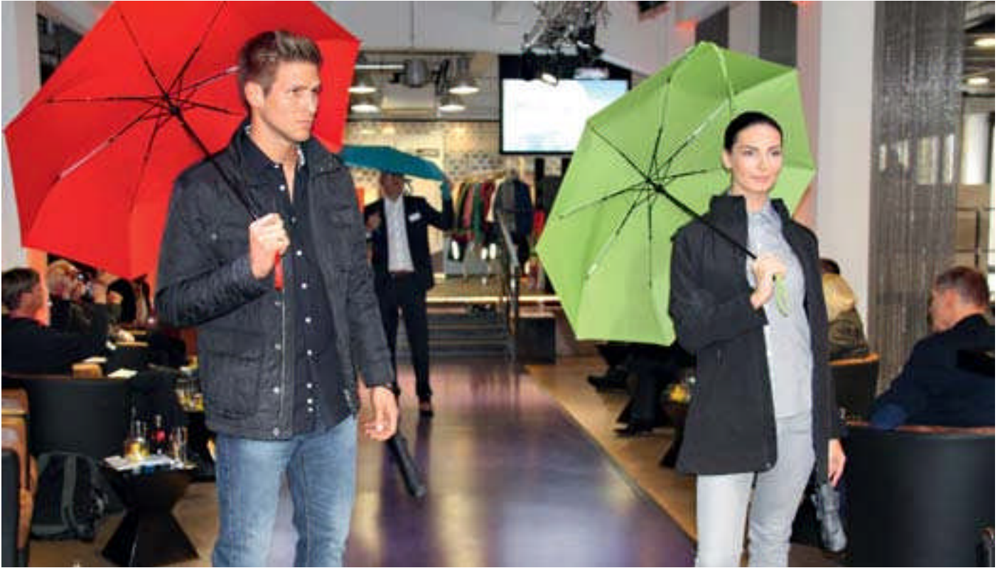
Sechs unter dem Dach der JCK-Holding versammelte Werbeartikelspezialisten präsentierten ihre neuen Kollektionen.